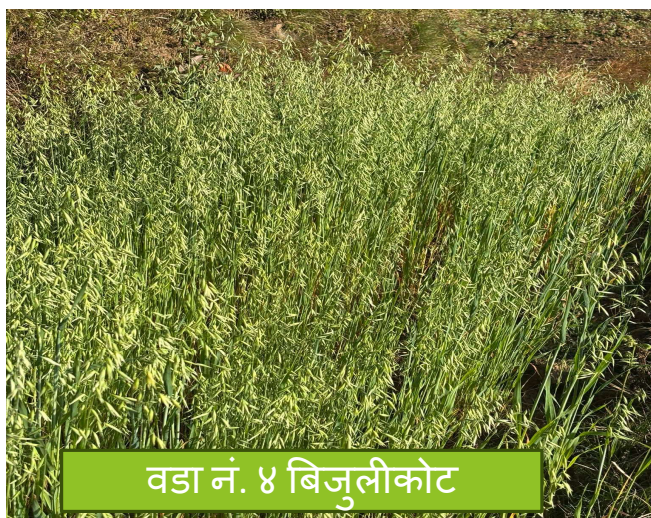
वडा नं. ४ बिजुलीकोट