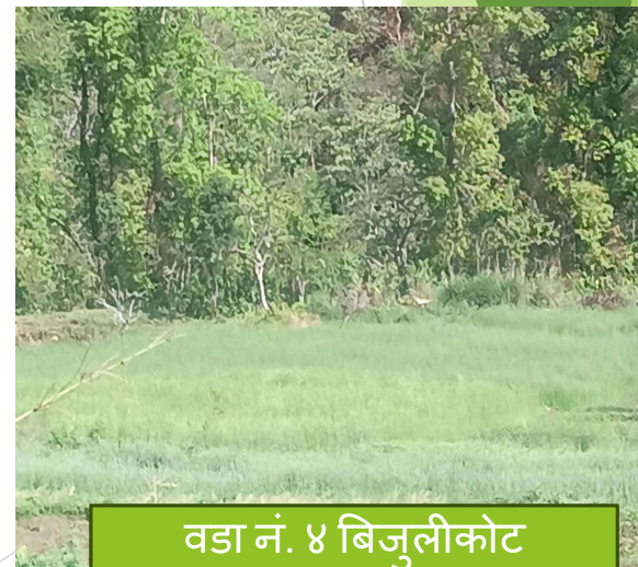
वडा नं. ४ बिजुलीकोट