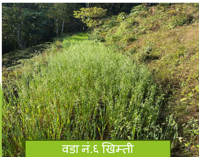
वडा नं. ६ खिम्ती